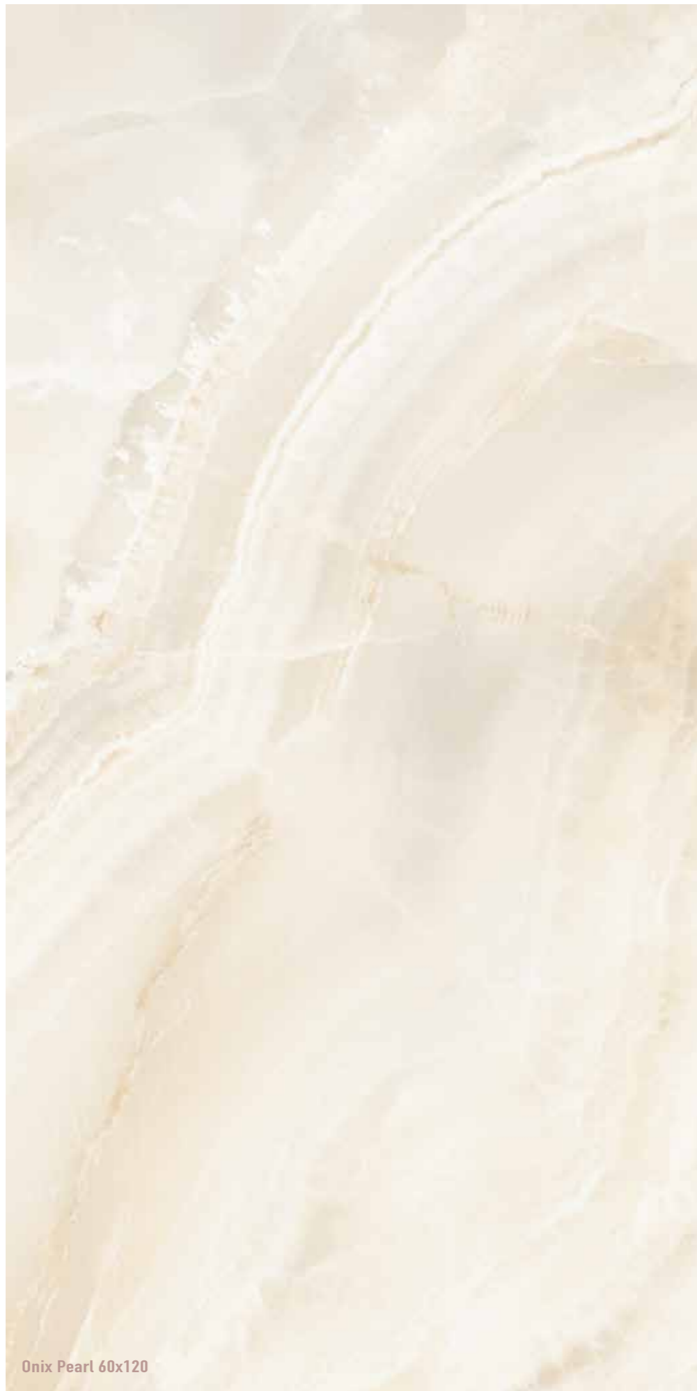
Onix Pearl 60x120